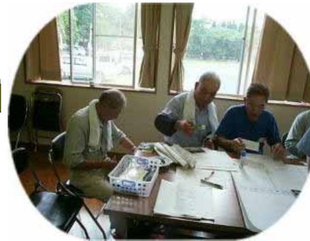
はさみで切つてのりではるんだぞや！