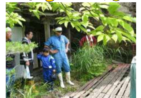
ぼくも登った山王岩屋