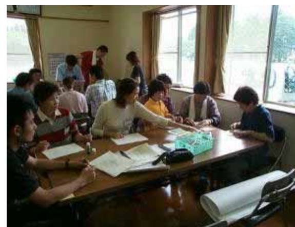
本寺シスターズにおまかせ