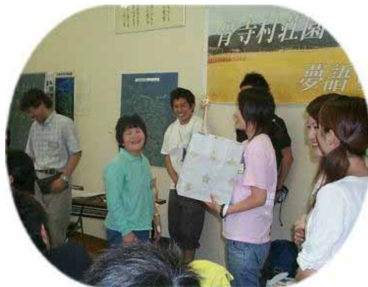
豪華景品もらっちゃった！