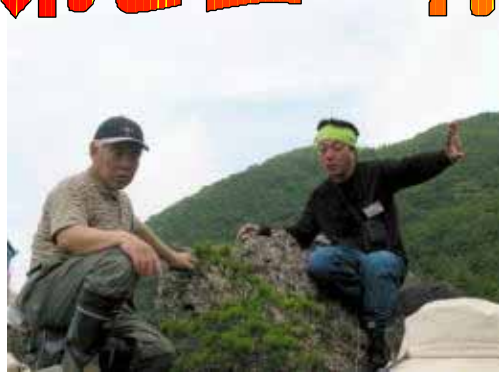
何年ぶりだべ山王に登ったの？