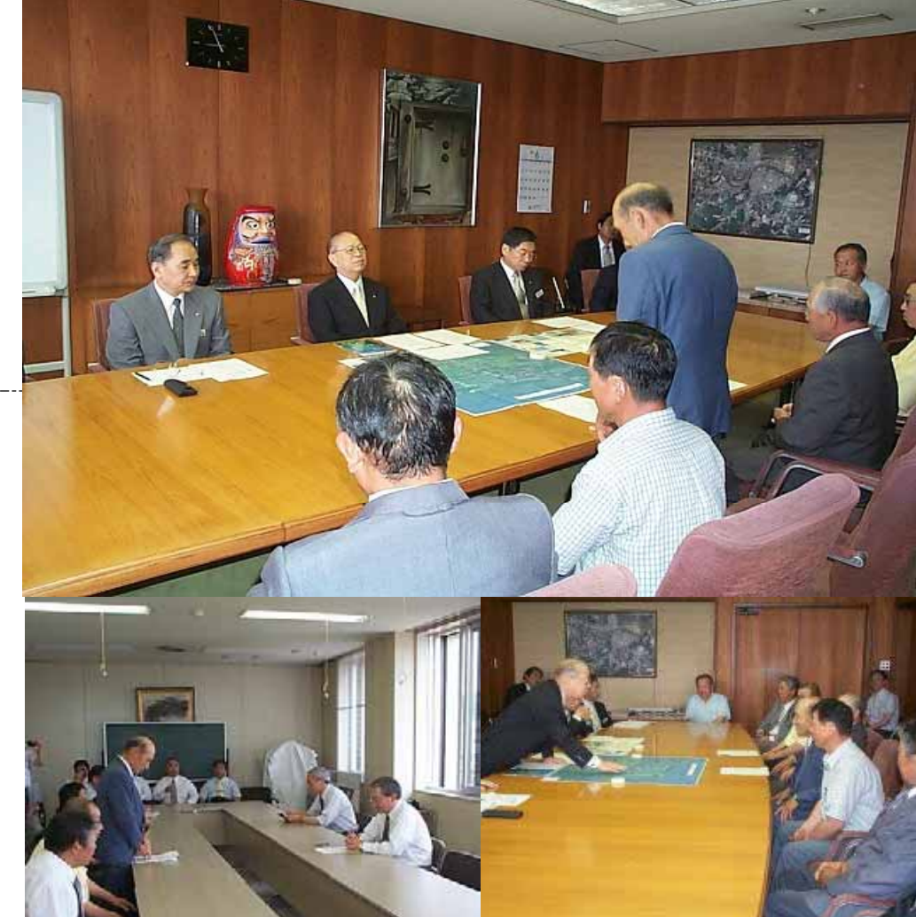
・藤尾振興局長(右側)・