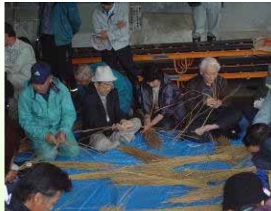
縄ない体験は先生がいっぱい