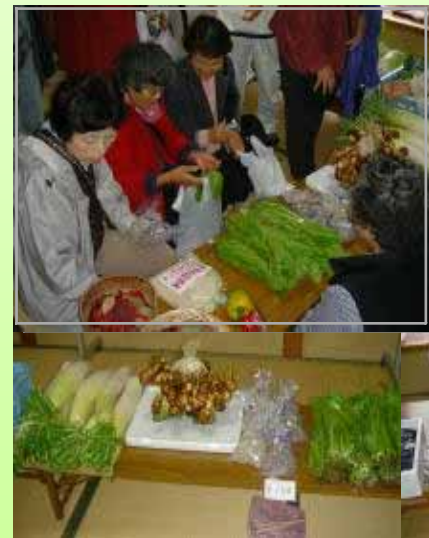
農民市は首都圏からの奥様方に大好評