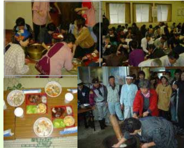
餅つき体験と餅料理での昼食交流