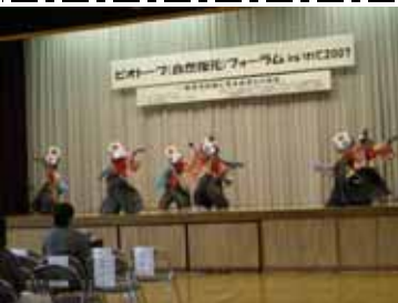
本寺中学校の生徒さんの鶏舞