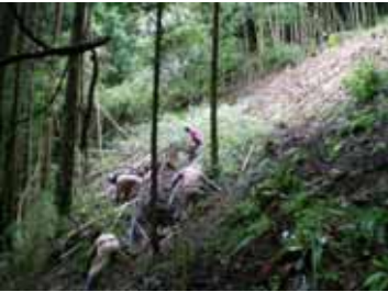
不動窟の竹を手送りで搬出