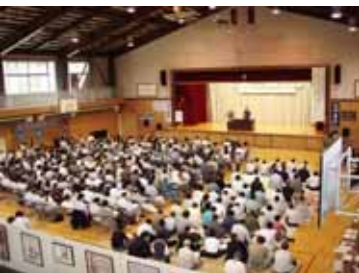
講演に耳を傾ける参加者