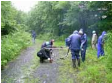
白山社の刈り払い作業

6月29日～7月1日の三日間、岩手教区隊140名の皆さんによる各史跡の刈り払い支援が行われました。隊では毎年各地で訓練として奉仕活動を行っています。