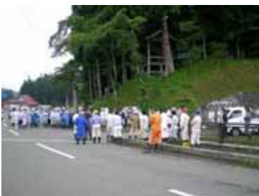
ボランティアに集まった皆さん