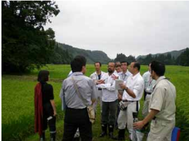
「この風景は写真集や絵葉書などに出てくる景観のようだ」