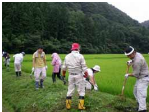
これは大変な作業だっちゃん～！

時折小雨が降る中、市職員、県職員、岩手大学、一般市民のボランティアの皆さんと地元の方皆さん総勢二百名による草刈り、草集め作業が早朝から行われました。イコモスの現地調査を前に「多くの人々が一体となって支えるきっかけになれば」との思いから、ボランティアによる景観保全が取り組まれました。