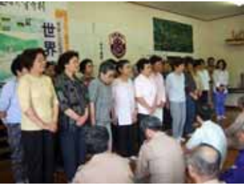
多くのお母さん方も参加