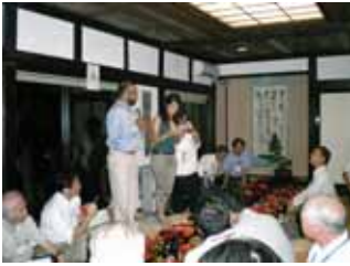
「うんめがすと」で歓迎会