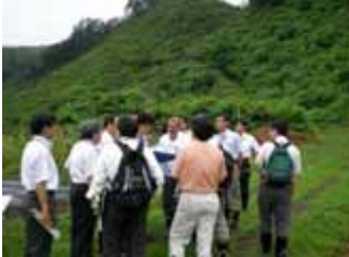
大師堂前で荘園景観を説明