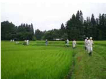
これだけの人数でも半日かかりました