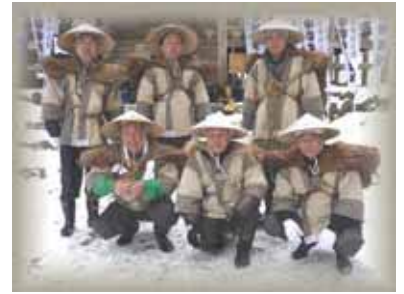
たぶん。一番疲れてたかもしれない～担ぎ手のみなさんです！