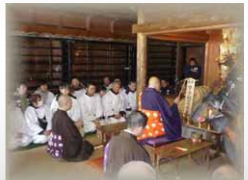
中尊寺・経堂に到着

国宝「紺紙金銀交写経」と秀衡公の平和への願い、それを支えた骨寺村莊園とつながりについて、ご説明いただきました。