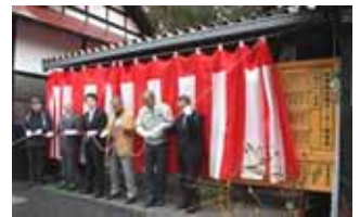
種蒔き式後、骨寺村荘園オーナー御芳名板のお披露目式です。古曲田家に設置されました（写真下は副市長）